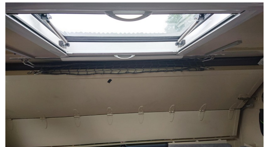
Zweites Bett, eingeklappt