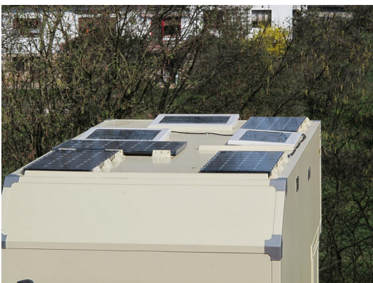
Solarzellen und Dachhauben