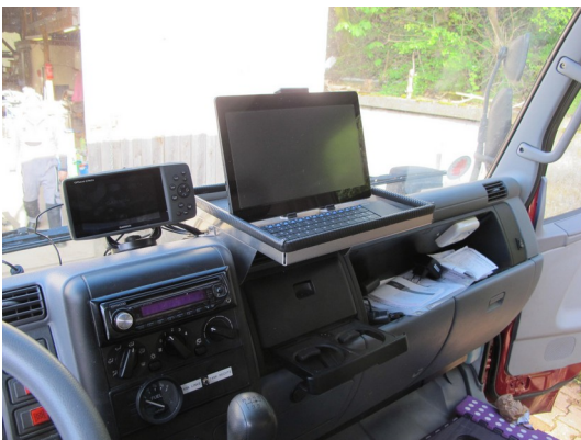
Im Fahrerhaus; GPS und Tablet