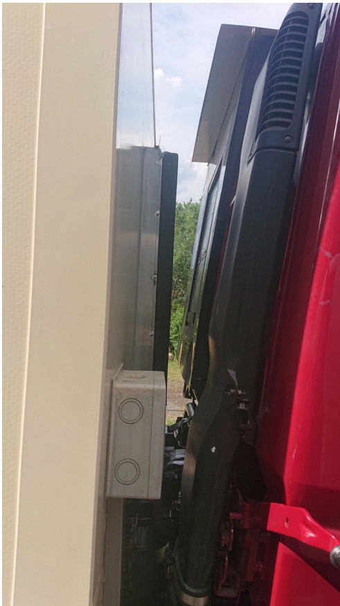
Das Fahrerhaus kann ganz einfach gekippt werden ohne irgendwelche Verriegelungen lösen zu müssen und ist trotzdem dicht