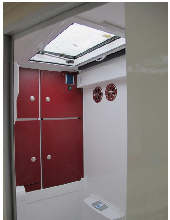
Nasszellenschränke über der Toilette