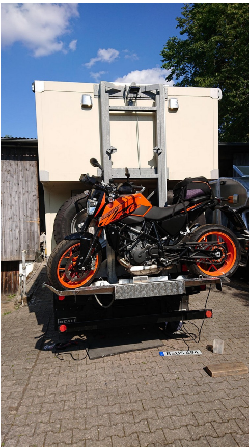
Motorrad auf der elektrisch absenkbaren Hebebrücke