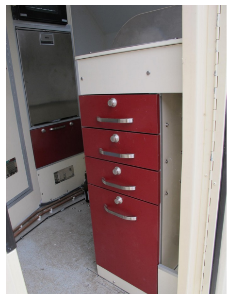
Besteck- und Abfalleimerschubladen