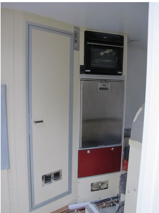
Hochschrank mit Kühlschrank und Backofen, links die Tür zur Nasszelle