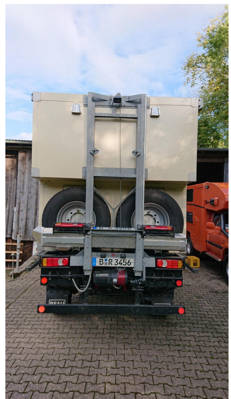
Motorradbühne, elektrisch absenkbar