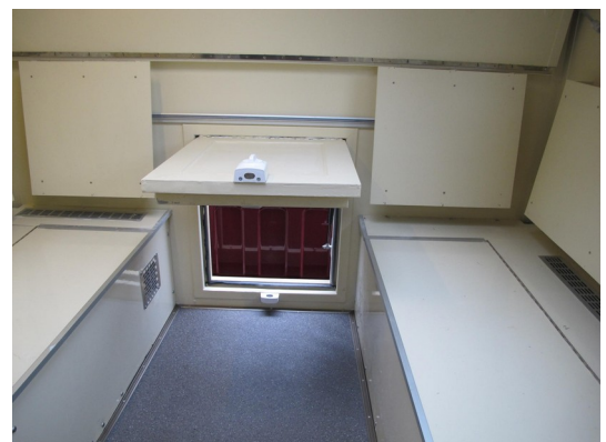
Durchschlupf zum Fahrerhaus