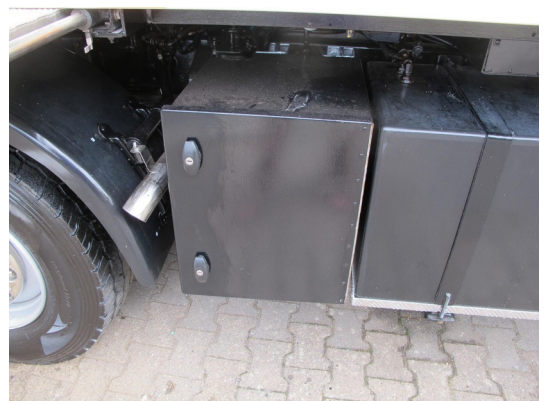
Staukasten und Kunststoff-Sprittank