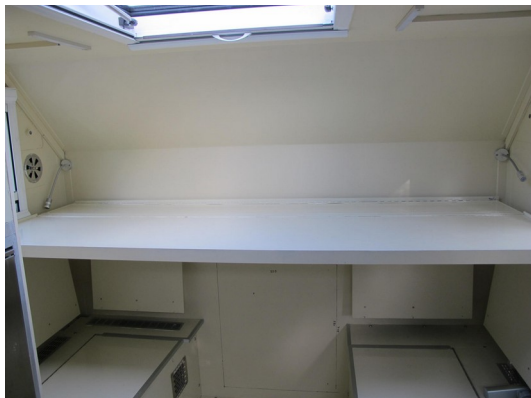
Zweites Bett, ausgeklappt