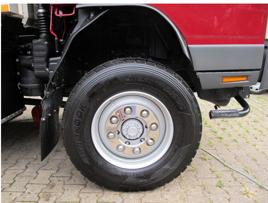
Edelstahl Mutternkappen und Schutzring