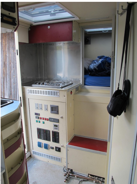
Kochecke, darunter Elektrozentrale; rechts Zugang zur Schlafkoje