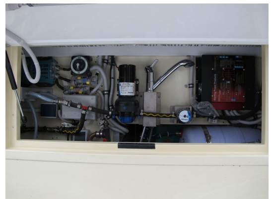
Serviceklappe rechte Seite außen mit Wasser- und Elektrotechnik