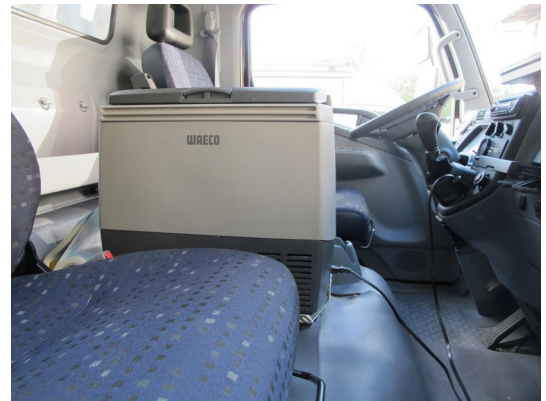
Kompressor-Kühlbox im Fahrerhaus