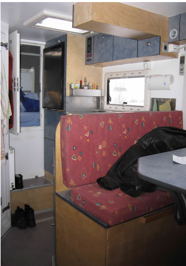
Blick zur Küche hinten links