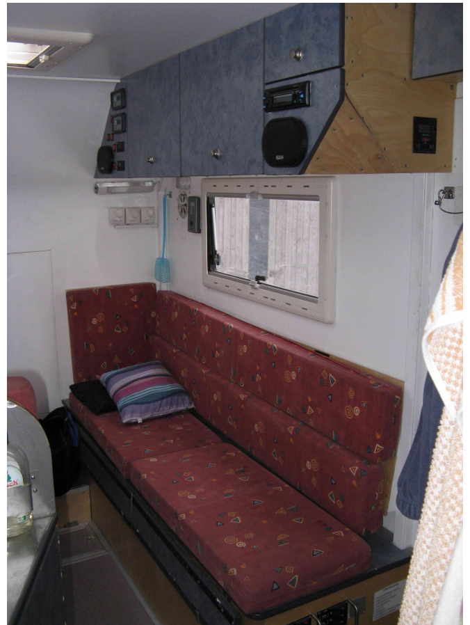
Sitzbank-Schlafstelle vorne rechts