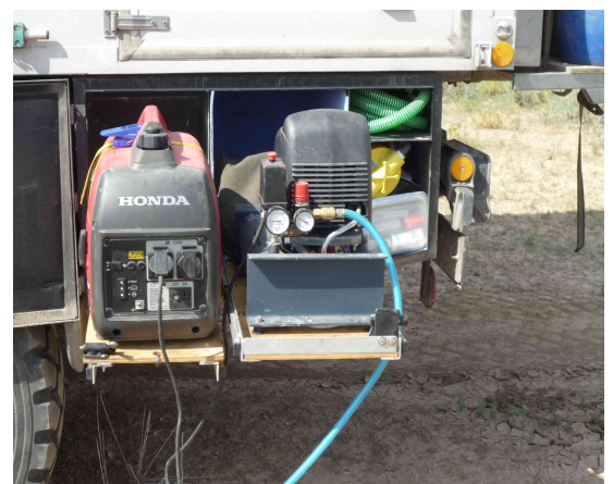
Staukasten hinten links Generator-Druckluftkompressor