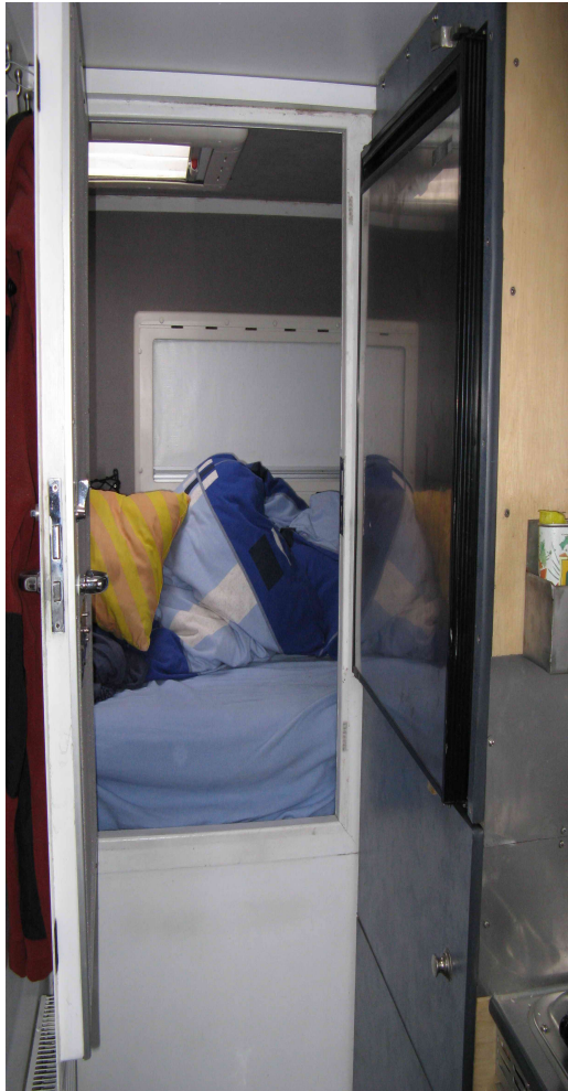
gesondertes Schlafabteil-hinten quer