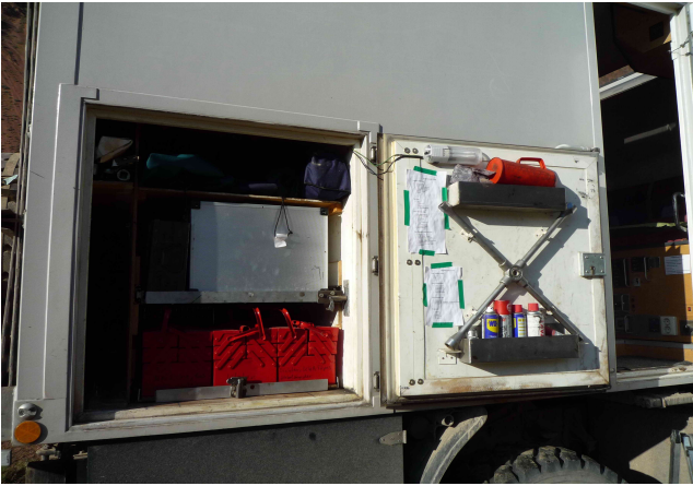
Staufach hinten rechts mit Schwerlastauszügen